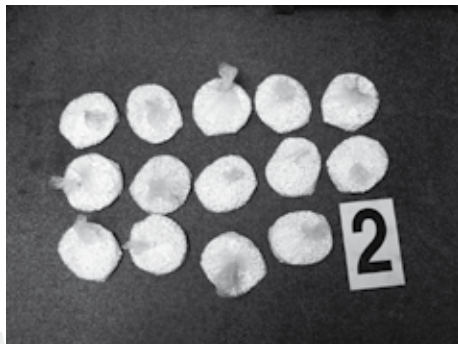
v každém sáčku 1000 ks Extáze