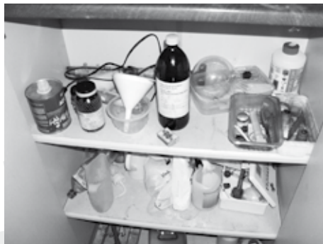
věci a přípravky na výrobu pervitinu